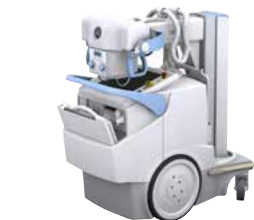
MOVIX SERIES DREAM