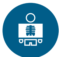
SOLUTIONS EN RADIOLOGIE