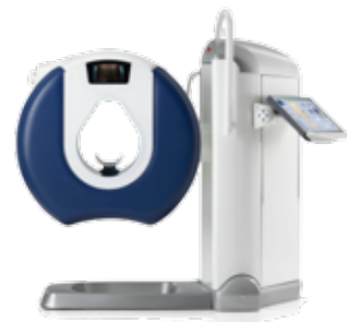
VERITY Imagerie 3D