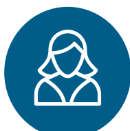
IMAGERIE DE LA FEMME