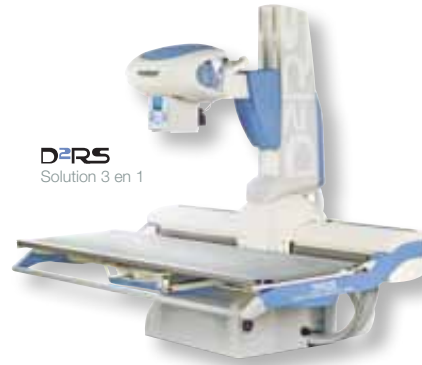
STATIF PRO DREAM Radiographie numérique