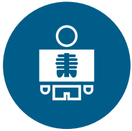
SOLUTIONS EN RADIOLOGIE