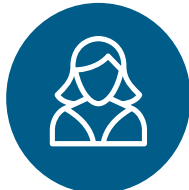
IMAGERIE DE LA FEMME

ORIGINE FRANCE® GARANTIE BYCent. 6182197