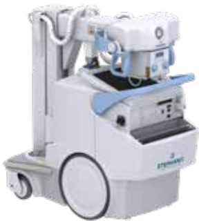
MOVIX SERIES DREAM